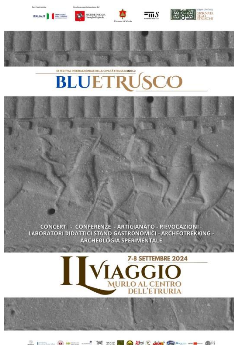
Manifesto del festival